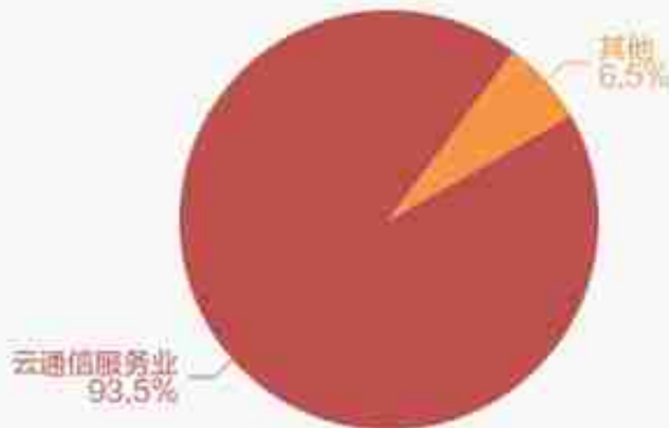
报告期各业务收入占比

公司2022年营业成本37.69亿元，同比增长36.6%，高于营业收入30.9%的增速，导致毛利率下降3.8%。期间费用率为10.1%，较去年下降4.3%。经营性现金流由-6.82亿元增加至4749万元，同比上升107%。