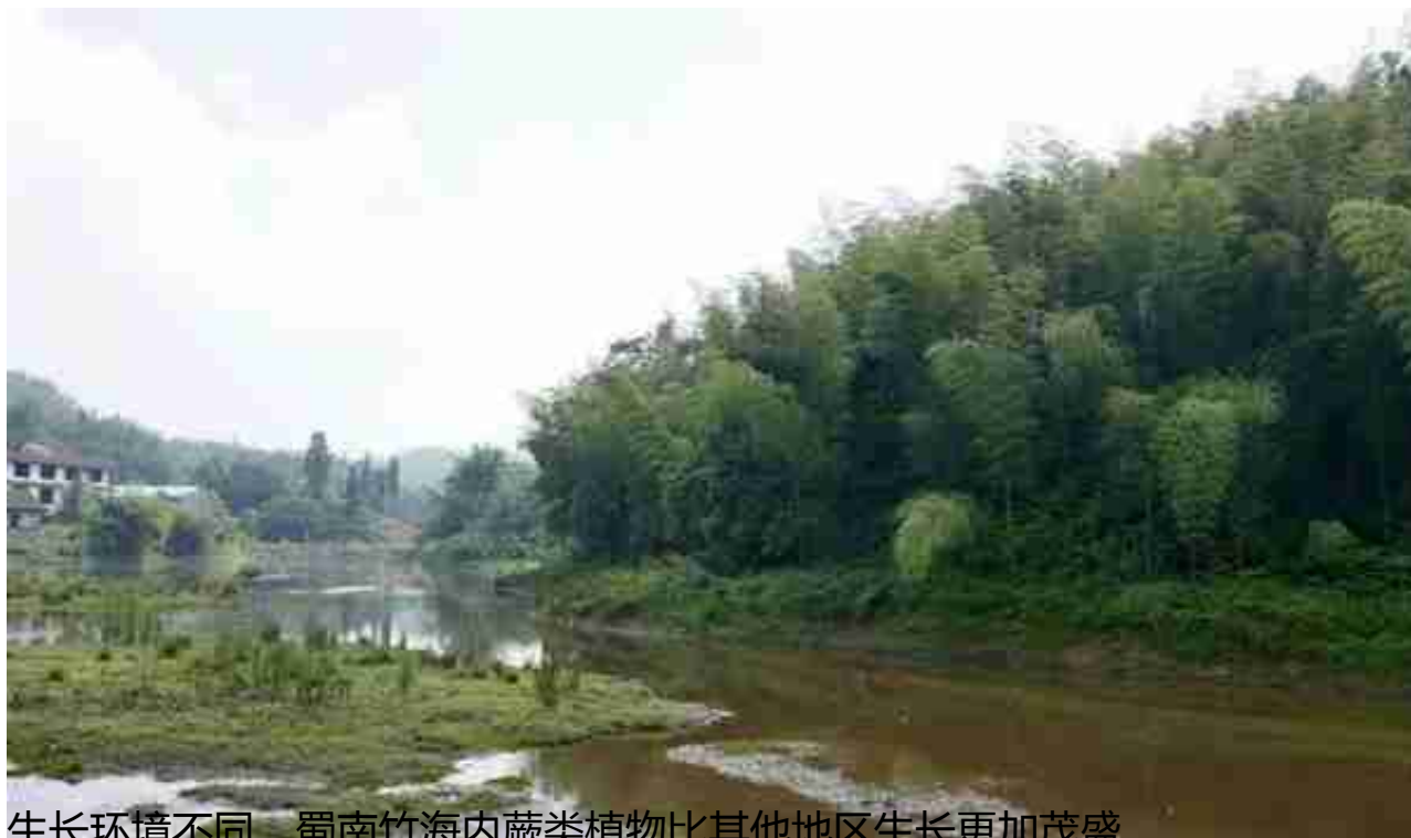
生长环境不同，蜀南竹海内蕨类植物比其他地区生长更加茂盛