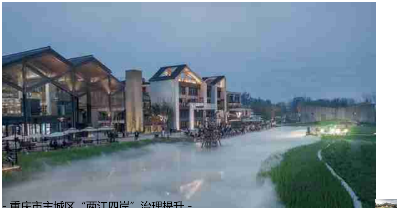
- 重庆市主城区“两江四岸”治理提升 -

基于对重庆城市特点以及基地生态环境的分析，提出“H.O.T”设计策略：H即Heal，通过引入生态措施，治理滨水生态系统，改善河流与沉积物之间的环境；O即Outreach，引导城市的潜在元素走向滨水；T即Transform，转型改造完整的滨水空间，使其成为重庆的活跃空间。