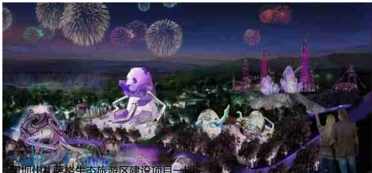
阿坝州扎萨格生态旅游区建设项目一期

以“绝美神鹰谷 净土扎萨格”--隐没在若尔盖草原里的神秘圣域 为设计主题，尊重当地的自然环境与生灵，坚持低介入的景观理念和生态开发原则。围绕无痕探索，融入自然的设计目标，旨在展现最纯净、最自然、最神奇的扎萨格风光，将其打造成为若尔盖、阿坝州旅游市场的新名片。（点击阅读：