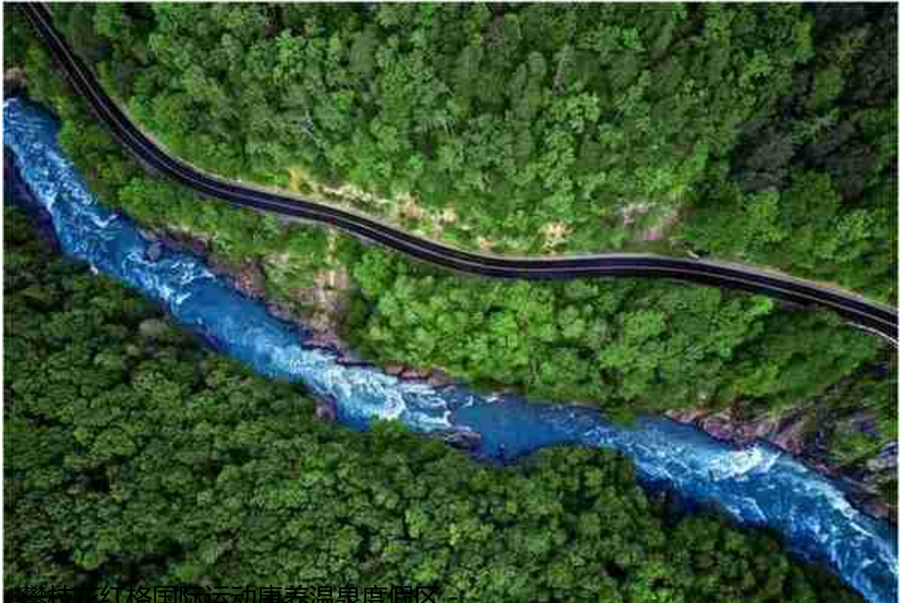
攀枝花红格国际运动康养温泉度假区

以健康为切入点，结合体育强身、生态养身、农文旅相结合、三产联动；深挖大箬文化之根、重塑红格山水之魂，依托攀枝花整体旅游战略，深挖文化资源，优化产业结构；以“世界眼光、红格特色”的国际占位全境布局，发现红格之美、再现竿风盛景；全链条融合发展红格全域康养，为红格可持续发展注入活力。