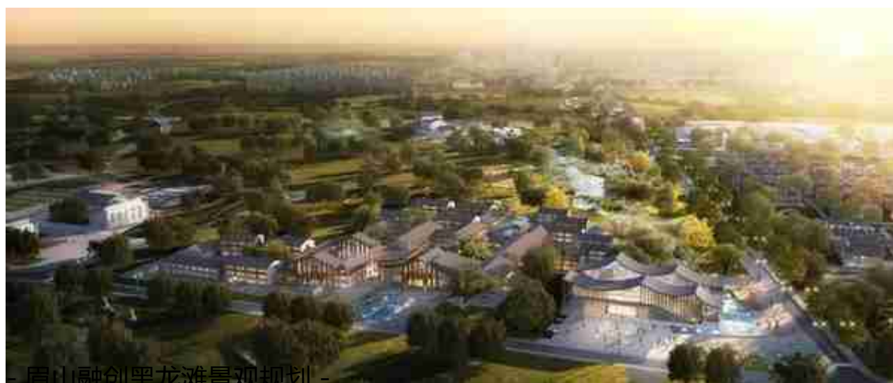
- 眉山融创黑龙滩景观规划 -

规划水体形态、丰富滨水景观，优化乡土植被、完善生态系统，植入海绵城市、缓解调蓄负荷，营造栖息空间、构建生物廊道，构建具有黑龙滩特色的健康生命库。