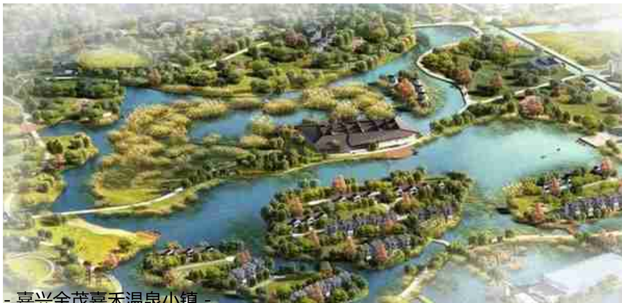
- 嘉兴金茂嘉禾温泉小镇 -

项目位于嘉兴市新塍镇，地处长三角城市群的核心区域，希望将其打造成为长三角经济圈的新燃点、长三角城市群的新中心。梳理场地导入路由，建立“三横三纵”对外交通骨架；通过多因子叠加分析，三大可建设区域空间分布明确；梳理蓝绿体系，以田园作为生态本底，塑造一轴一环四片空间结构。