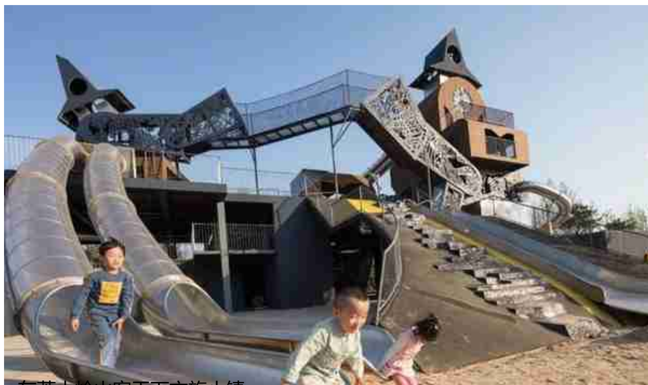
- 东莞大岭山客天下文旅小镇 -

依托五千亩荔枝水乡风光，围绕“荔枝、草、飞鹅、水”等核心元素，打造融合地域特色的国际化主题IP，以创意+多元产业体系充分发挥客天下品牌优势，高起点规划、高标准建设、高品质管理打造东莞旅游标杆项目，助力东莞“湾区都市、品质东莞”的实现。