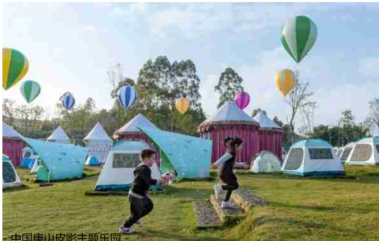
- 中国唐山皮影主题乐园 -

欢乐田园以尊重原始风貌、注重保护环境为前提，以“敛天府农耕盛景，创乡村振兴华章”为目标，创新打造川江草海、锦城花岛、古佛花溪、武阳茶谷、七彩森林、大河梯田、鹿溪牧场七大主题区域，与“黄龙溪故事”一脉相承，让天府文化、川蜀田园慢生活鲜活起来，创造不一样的农创体验！