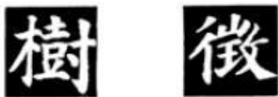
图 69 三体结构

偏旁和主体部分依靠紧密。如“程”、“澮(澮)”、“娠”、“龙(龍)”等字(图68)。“程”字“禾”旁的撇、短横、右捺点的收笔都紧靠“呈”字，而左旁的起笔则向左边的空间舒展，“呈”字末笔横画则又深入“禾”的下部空间。相互依靠、伸延，使两部分形成紧密的结构。“澮”字三点水上两点紧靠人字左撇上部，“龍”字上两横画收笔紧靠右边，形成左右紧密的结构。如写不妥当，结构就散了。在此帖的左右结体中，细致观察都可以找到这种联结点。临写时要特别注意这种穿插。