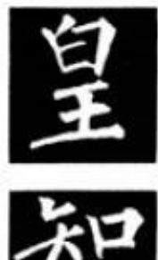
图 91 上下结构

左右两部分并列结构的字，联系较密切，通过笔画的穿插、呼应，形成一个结构严谨的整体。如“”、“雄”、“亲（親）”、“既”等字。（图91）