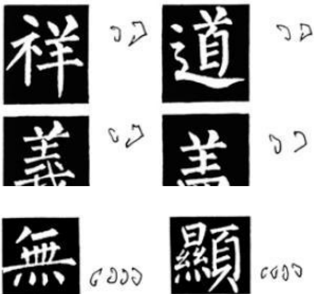
图 94 下四点写法（之一）