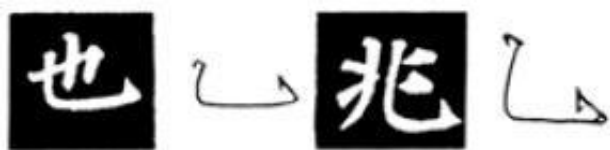
图 85 钩的写法

（5）左上、下撇笔法。《多宝塔碑》的左上、下撇，笔画劲而细，刚中有柔，犹如飞矢。如“水”、“如”。起笔顿挫重，行笔逐渐细成尖状。行笔速度稍快，才能露锋有飘势。若行笔滞留，就写不出气势。（图86）