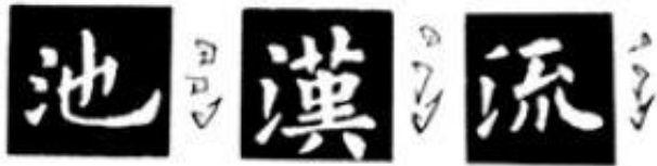
图 57 三点水写法