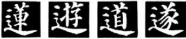
图 71 紧字结构

颜字的“戈”法不像欧字那样有特点，结构比较平凡，基本写法一致，只是长短斜度有所差别，其结构也是三角形，“戈”字竖笔起笔是三角形上锐角。如“感”、“式”、“灭(滅)”、“我”等字(图72)。但有的(如三体并列结构的字)就不是呈现三角形结构，如“识(識)”字等。欧字的“戈”字结构在整个字中也成三角，但上角度更尖锐，故纵长。颜字《多宝塔碑》的戈法，三角底线角度大，更接近等边三角形。