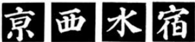
图 73 点字体势

颜字的“戈”法不像欧字那样有特点，结构比较平凡，基本写法一致，只是长短斜度有所差别，其结构也是三角形，“戈”字竖笔起笔是三角形上锐角。如“感”、“式”、“灭(滅)”、“我”等字(图72)。但有的(如三体并列结构的字)就不是呈现三角形结构，如“识(識)”字等。欧字的“戈”字结构在整个字中也成三角，但上角度更尖锐，故纵长。颜字《多宝塔碑》的戈法，三角底线角度大，更接近等边三角形。