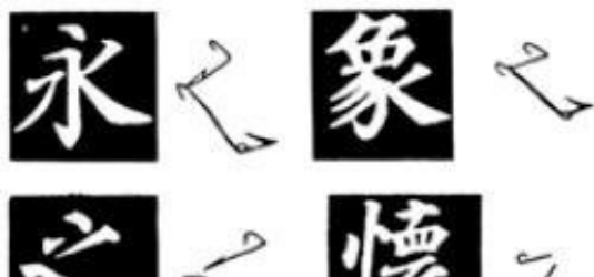
图 86 左上、下撇笔法

（5）左上、下撇笔法。《多宝塔碑》的左上、下撇，笔画劲而细，刚中有柔，犹如飞矢。如“水”、“如”。起笔顿挫重，行笔逐渐细成尖状。行笔速度稍快，才能露锋有飘势。若行笔滞留，就写不出气势。（图86）