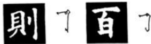
图 60 短横转直笔写法

非主笔的横画写法，用中锋顺笔入，笔画细硬，或由左细到渐粗收笔。如“壁”的短横画，“痼”的第一短横画，“扶”字的横画等。（图60）