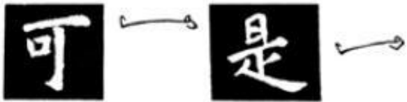
图 58 横画写法

非主笔的横画写法，用中锋顺笔入，笔画细硬，或由左细到渐粗收笔。如“壁”的短横画，“痼”的第一短横画，“扶”字的横画等。（图60）