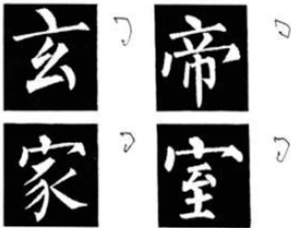
图 93 中心点写法

第三，注意此碑中有的结体点画不协调的字，可以不必临写，或者不必完全照临，可以作些调整。如“阐（闡）”字，“門”字过大，“單”字过小。又如“括”字，整个字歪向左方，且偏旁“扌”和“舌”字也拉开了，这是偏旁横画短，“舌”字横画左方短，“口”字左竖画又斜向右面造成的。（图94）