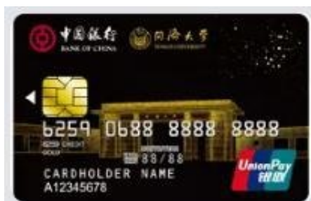
中银同济大学认同卡

如果您所在的城市有北京银行营业厅的话，您真的可以一边将资金投入51人品中理财，一边申请北京银行的信用卡，因为您在51人品投资理财的资金均由北京银行管存，也就意味着您和北京银行是有资金业务往来的，这也意味着您在北京银行开立了电子银行帐户了，您仔细翻翻您的51人品帐户不就知道了：