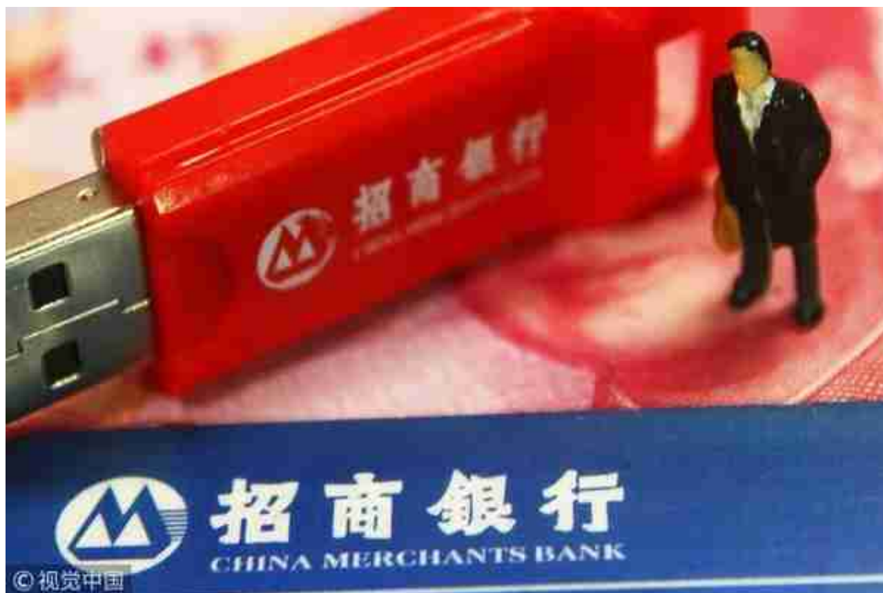
招商银行U盾

然而随着移动互联网时代的到来，主要面向PC网银的U盾转账方式已经落后了。尽管近几年也衍生出现音频盾（通过手机音频口外接设备）和蓝牙盾，但糟糕的用户体验让这种支付方式并不为大众所接受。