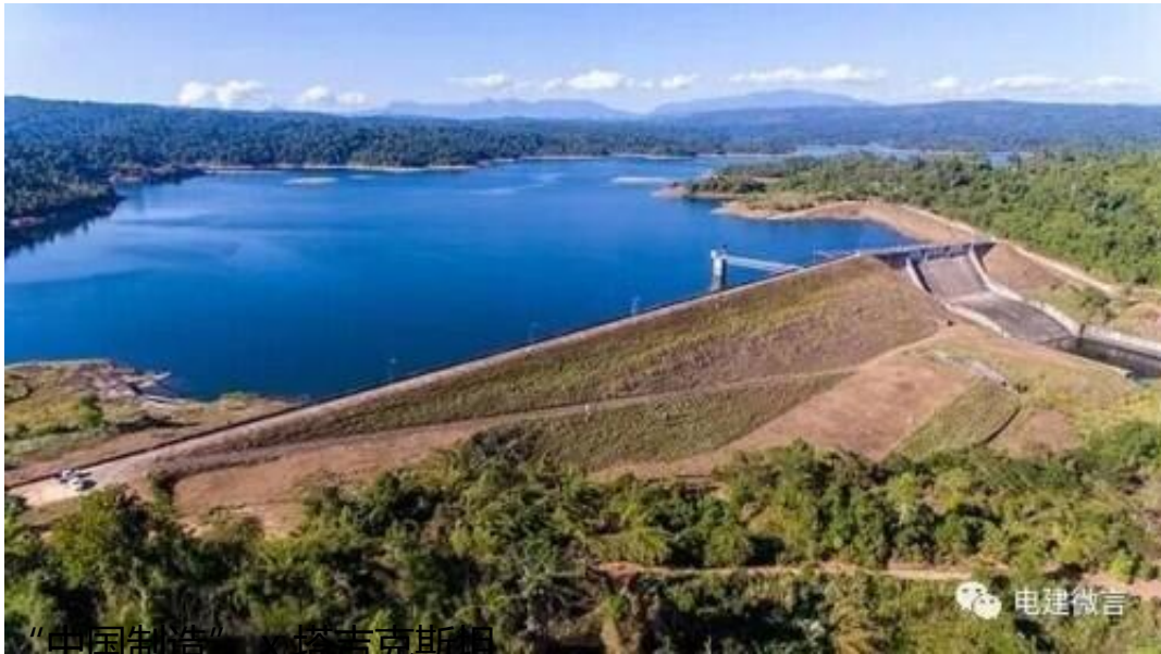
“中国制造” x 塔吉克斯坦