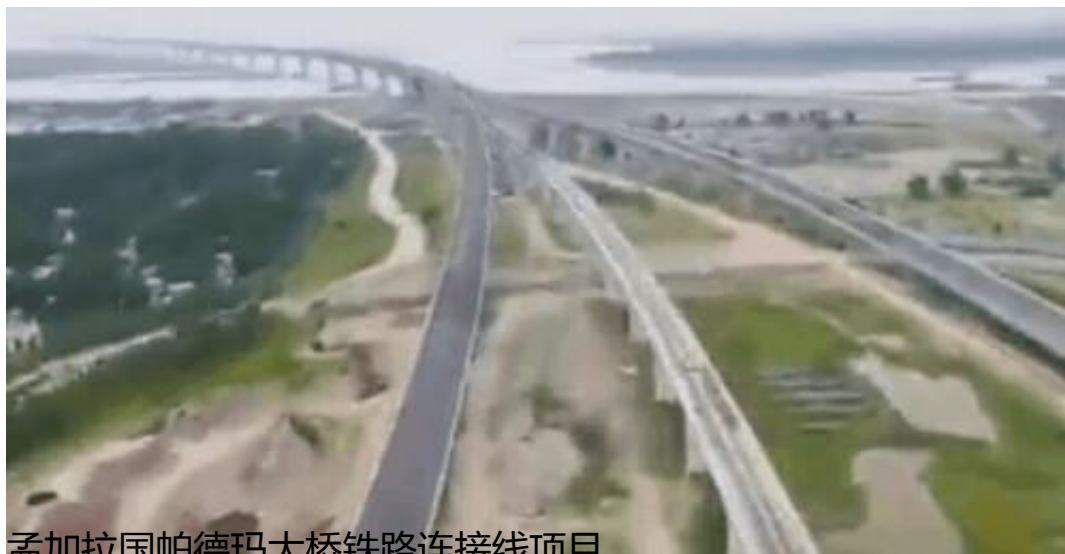
孟加拉国帕德玛大桥铁路连接线项目