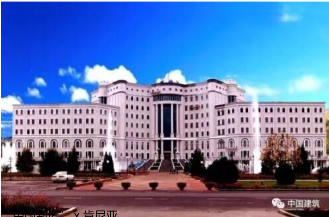
“中国制造” x 肯尼亚