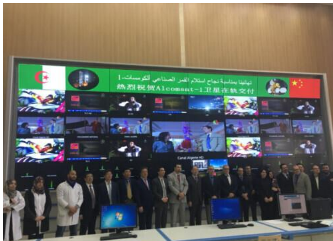
2018年4月1日在阿尔及利亚首都阿尔及尔中阿双方代表在交付仪式上合影留念。

“这是阿尔及利亚第一颗通信卫星 在民用、军用上可以发挥巨大作用 具有极其重要的战略地位” 阿尔及利亚将这颗卫星的 制造和发射交给中国 是对中方伙伴的信任 体现了两国长期以来的 友好合作关系 新版500第纳尔纸币上除了阿星一号 还印有阿尔及利亚地理版图和