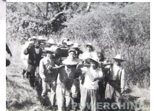
中非工人在几内亚金康水电站运送机械设备。