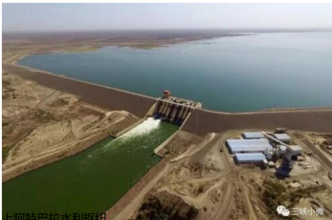
上阿特巴拉水利枢纽