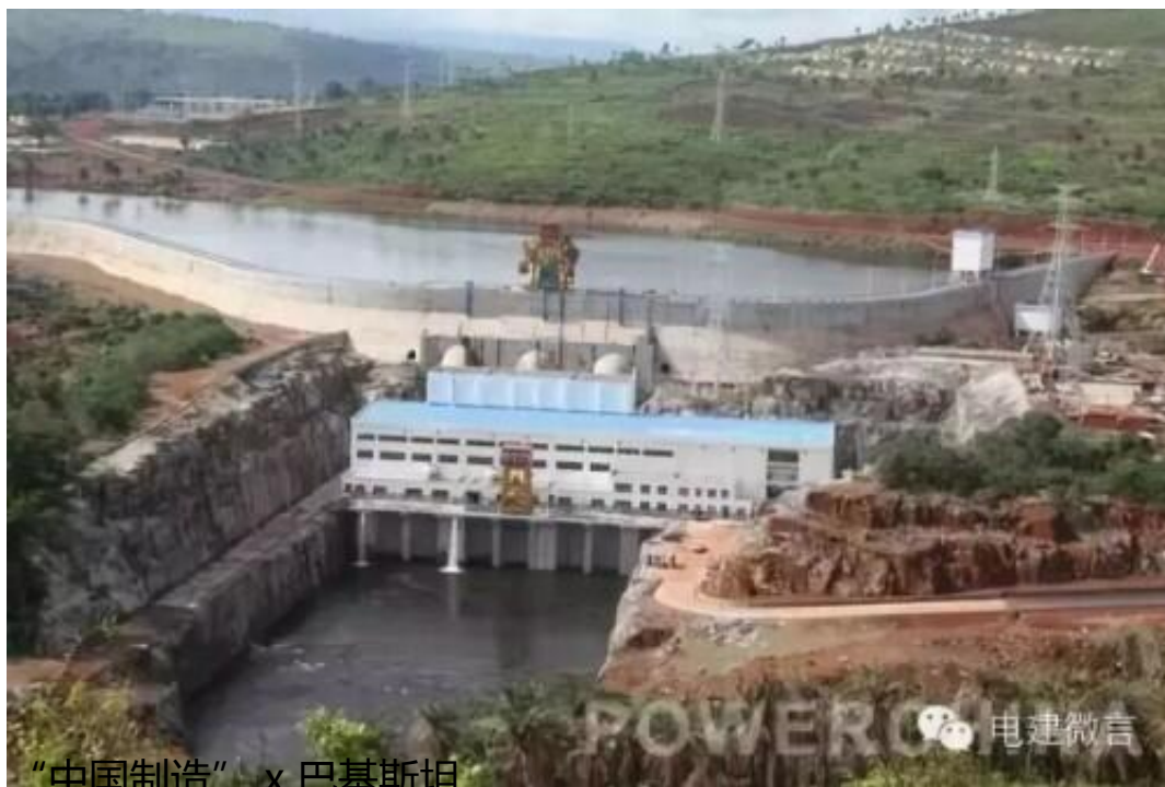
“中国制造” x 巴基斯坦