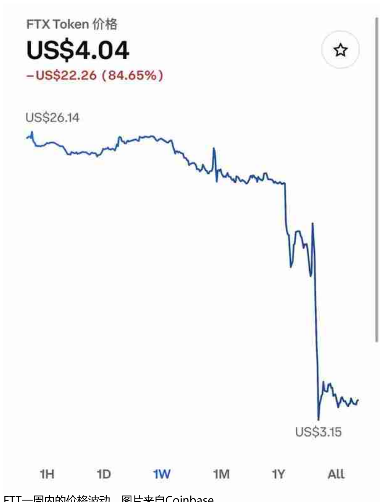
FTT一周内的价格波动。

“币安抛售FTT肯定会加剧恐慌。因为FTX创始人的部分抵押品就是FTT。如果币安抛售FTT，让FTT大幅下跌，抵押品价值不够，就会发生爆仓和违约风险。加密市场