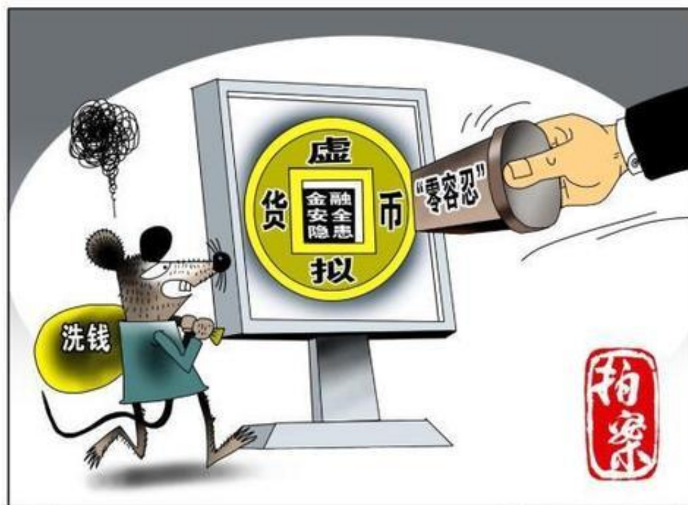
打击虚拟货币洗钱犯罪任重道远