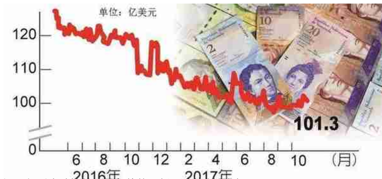
近几年委内瑞拉外汇储备趋势

但是，即使经济活力困倒至此，依然有人在经济通胀危机中在牟取暴利，比如，委内瑞拉的货币黑市市场中，由于汇率的巨大差距以及美元荒，一些致力于外汇倒爷可能正在“大发横财”，他们逢低买进美元，再到黑市脱手套现获取差额利润，因为，正如本文开头所描述的那样，虽然靠数月前发行的石油币筹集到一些资金，但事实上委内瑞拉几乎用尽了其大部分外汇储备，在美元荒的背景下，也很难再买到进口生活的必需物资，要知道，眼下，委内瑞拉市场上现金极度稀缺，以物易物成了委内瑞拉人的生活方式，比如，用面包换药品、用钻石换玉米...在委内瑞拉早已司空见惯。