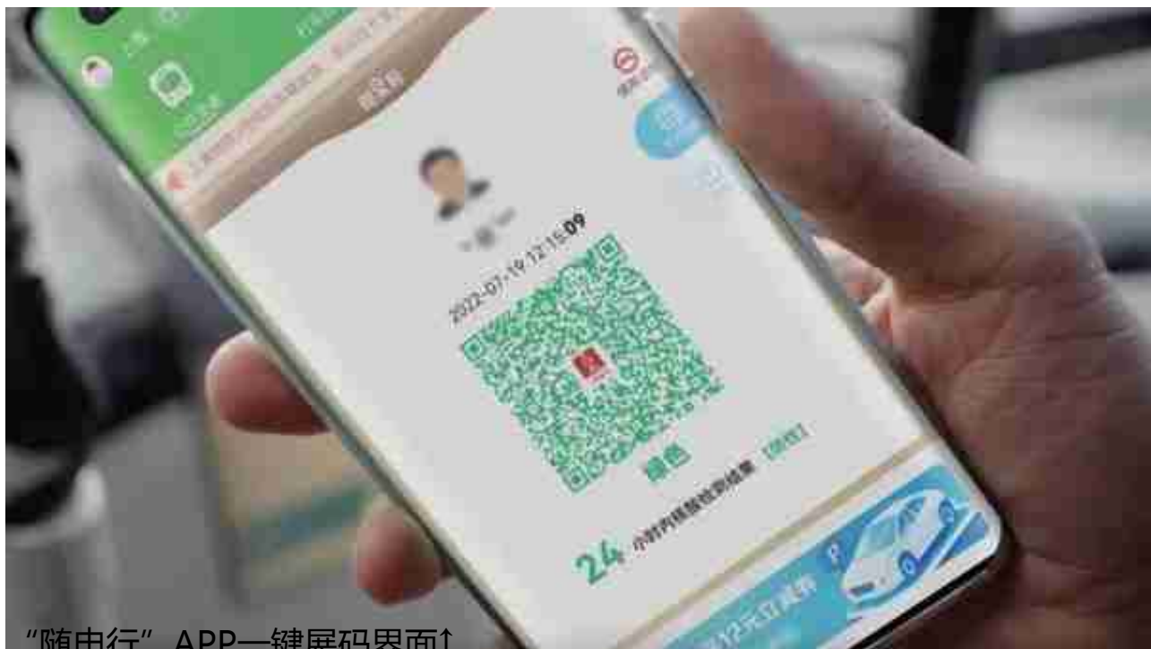
“随申行”APP一键展码界面↑

地面公交、浦江轮渡、打车出行、智慧停车等出行服务“一键达”。“随申行”APP 1.0版内设“公共交通”、“打车出行”和“上海停车”三大功能模块，提供一站式的出行服务：一是“公共交通”服务覆盖全市1560多条公交线路及17条轮渡线路；市民还可以在APP内报名“随申码”乘地铁招募活动，成为5万名白名单用户即可在11条轨道交通线路的指定闸机刷“随申码”乘坐地铁；二是“打车出行”服务依托于上海市出租车统一平台——“申程出行”，整合全市优质的出租车司机资源；三是停车服务覆盖全市4300多个公共停车场（库）和收费道路停车场、89万个公共泊位。