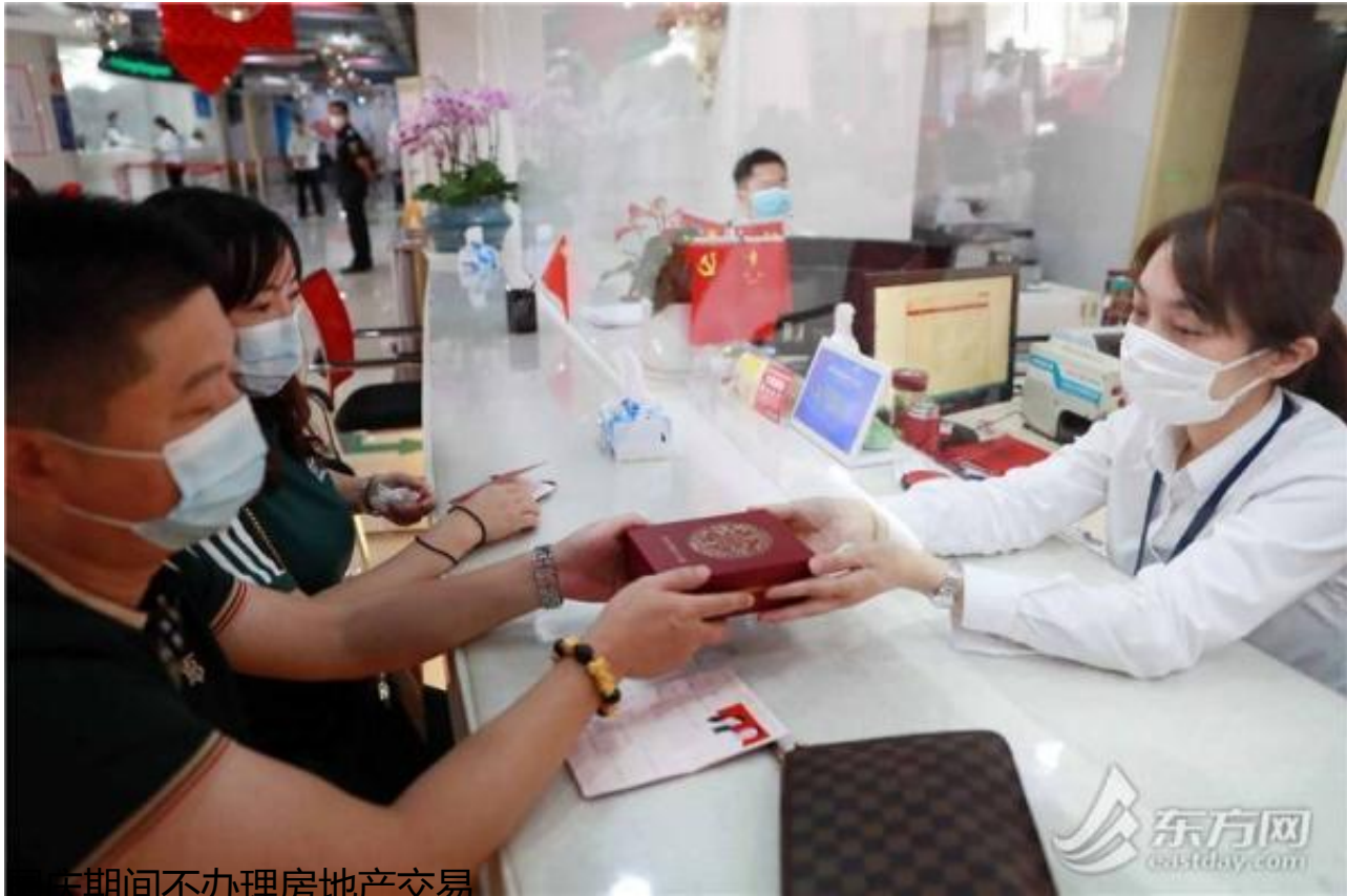
国庆期间不办理房地产交易

想把事情攒在国庆假期办掉的市民请注意，“十一”黄金周期间，上海部分机构办事服务窗口的接待时间有所调整。东东为您提前做了“功课”，小心别白跑哦。