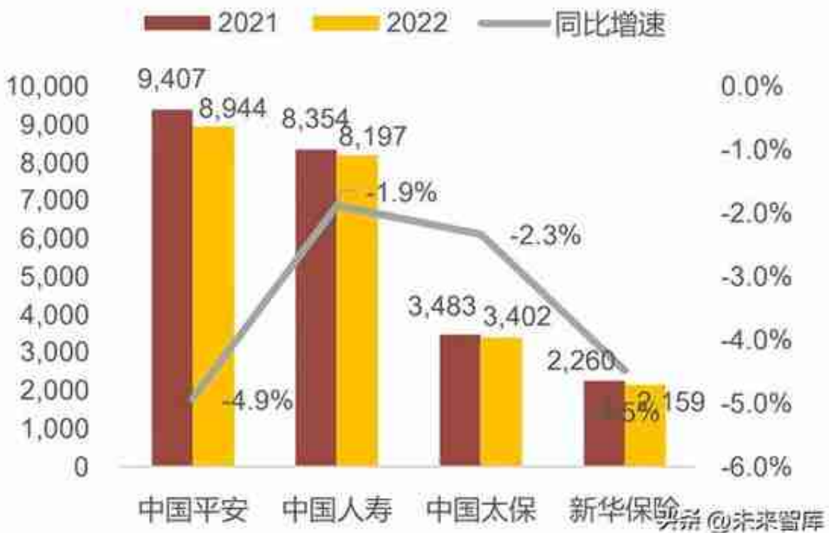
图8.上市保险公司剩余边际余额（单位：亿元）

22年五家上市险企归母净利润合计减少19%，主要受资产端拖累。22年平安、国寿、太保、新华、人保分别实现归母净利润838亿元、321亿元、246亿元、98亿元、244亿元，分别同比-17.6%、-36.8%、-8.3%、-34.3%、+12.8%，主要受资产端拖累，人保正增长主要由财险业务盈利能力大幅改善带动。受净利润较大幅减少影响，22年平安、国寿、太保、新华ROE分别-2.9pct、-3.9pct、-1.3pct、-4.9pct至10.0%、7.0%、10.8%、9.3%，人保ROE提升0.8pct至11.1%。