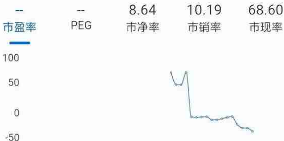
三五互联市盈率趋势图