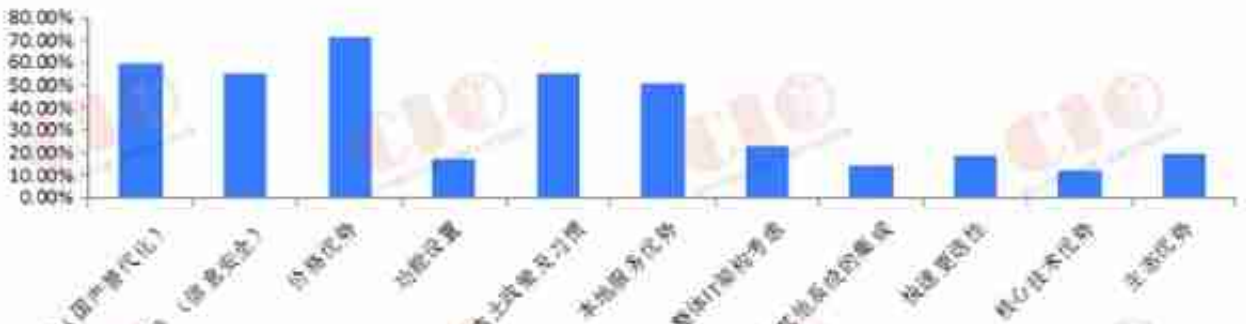
数据来源：CIO发展中心《关于企业核心IT系统国产化现状及趋势》调研数据

面对日益复杂的国内外市场格局变化，信息系统的国产化替代需求越来越紧迫。而从中国企业尤其是央企来看，核心业务系统软件的国产化替代趋势也在加速。本文作者对HR软件的国产化替代趋势进行了分析，一起来看一下吧。