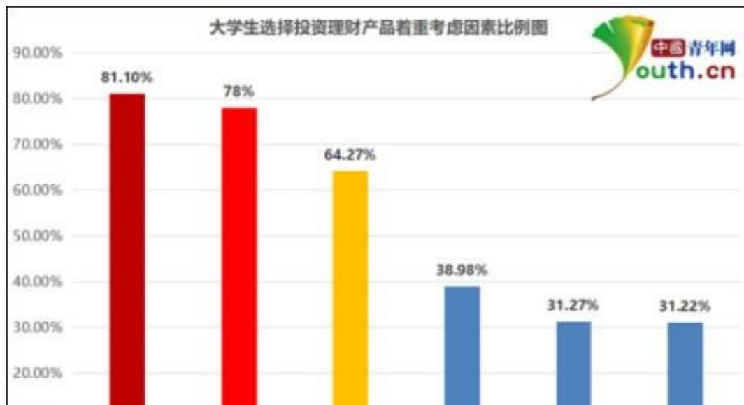
大学生选择投资理财产品着重考虑因素比例图。中国青年网记者 李华锡 制图

“大学生投资理财可以让自己对金钱的使用有一个更好规划，有时候也可以应对一些紧急用钱的情况。”湖南科技大学曾洁进行投资理财有一段时间了。她每月生活费2500元，会用500-700元放进理财软件进行理财。她认为，大部分学生还都没有实现经济独立，经济来源大都来源于生活费，所以一般都是使用生活费进行投资理财。