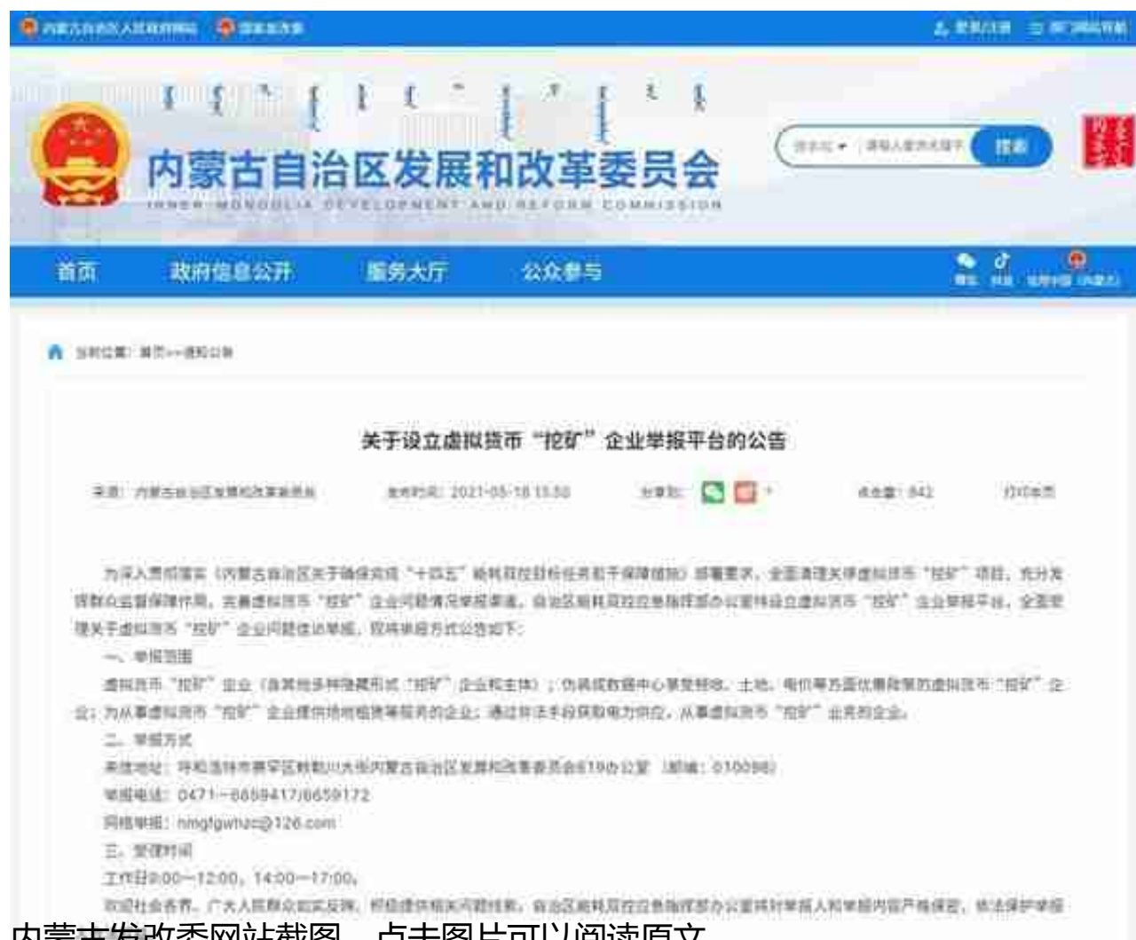
内蒙古发改委网站截图。点击图片可以阅读原文