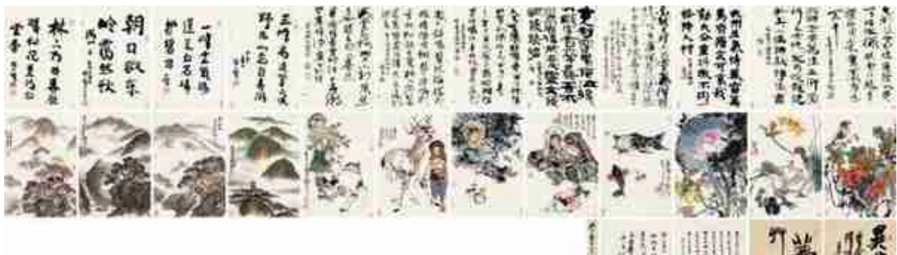
程十发《赠郁重今书画合璧巨册》

本届拍卖会中，《禾风》中国书画夜场重磅呈现名家精品佳作60余件。李可染晚年精品《高岩飞瀑图》是其晚年在水墨语言上进行勇猛精进探索的重要之作，尤其是层层积墨与逆光法的运用，体现其高妙的艺术水准与超强的控制能力，不啻为画家暮年名迹。程十发《赠郁重今书画合璧巨册》，是程十发为知己郁重今先生特别创作的铭心之作，集山水、人物、花鸟、书法之大成，全面展示了程十发先生早年、中年至晚年书法独特风格的确立过程，殊为难得，作品体量之大、尺幅之大极为少见。此外专场还汇聚了潘天寿、齐白石、黄宾虹、吴湖帆、赵朴初、弘一等名家作品。